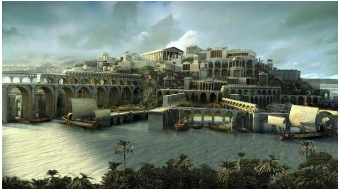
The Three Falls of Atlantis – Die drei Abstiege von Atlantis

Übersetzer-Team: Benario, Chaglia, Herzilein , Maarde, Solveig, Torsten